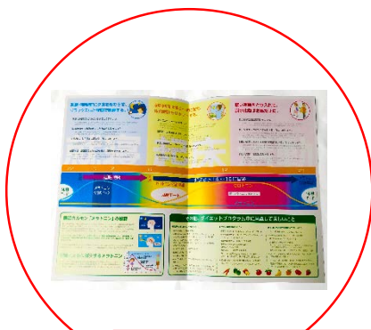
3週間プログラム手引きマニュアル／1枚